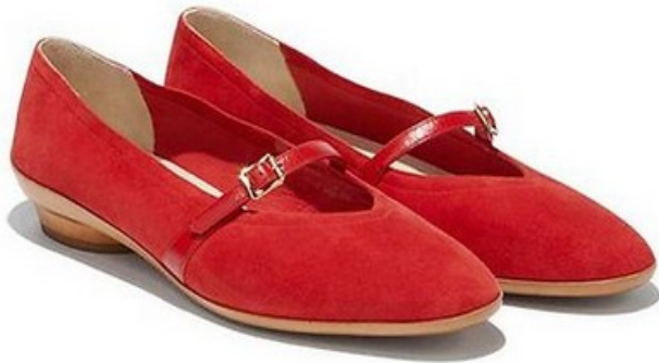
La Ballerine Audrey rendu célèbre par l'actrice Audrey Hepburn - Ferragamo

VALÉRIE LÉBOUCQ | LE 21/05 À 17:35, MIS À JOUR LE 22/05 À 07:14